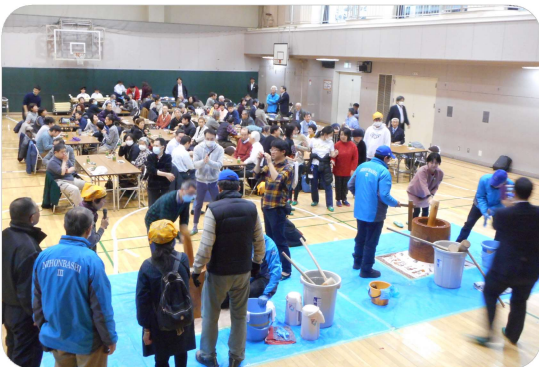
よいしょっ！よいしょっ！の音が響く体育館

2月3日、第35回「中央区心身障害者・児の進路と生活を考える会」のおもちつき大会が、有馬小学校体育館で開かれ、たくさんの方が参加しました。