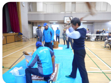
私も力いっぱい ペタン！ペタン！