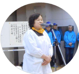
あいさつをする前場会長

2月3日、第35回「中央区心身障害者・児の進路と生活を考える会」のおもちつき大会が、有馬小学校体育館で開かれ、たくさんの方が参加しました。