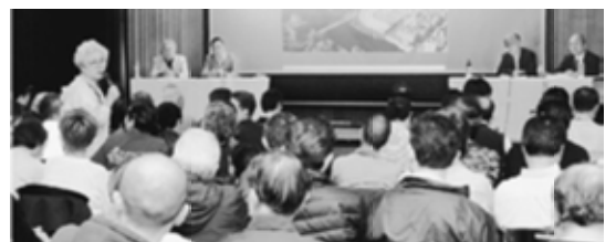
東京都専門委員に意見や質問を述べる市場関係者＝8日 築地市場内

一方、豊洲新市場を開場した場合、市場会計の破綻を回避するため、市場業者が支払う使用料を値上げする