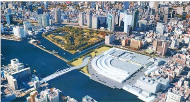
「築地改修案」の完成予想

「改修案成功の条件は、ただ一つ。築地で営業を 続けたいという気持ちがあればいいか」と強調