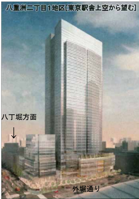
復興小学校である城東小学校を壊して(!) 250mのオフィスビルを建設する開発計画。