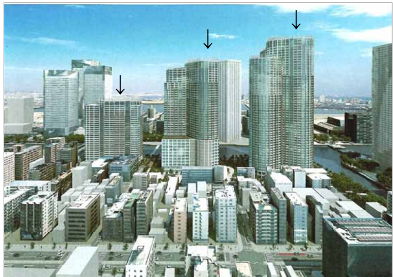
計画が1年遅れるなか「先が見通せない」状況となった勝どき東地区の完成イメージ図（矢印の3棟）。他の計画は大丈夫でしょうか。

6月10日の築地等まちづくり及び地域活性化対策特別委員会で、15年度の「再開発事業等の大規模開発計画」（裏面に地図）が報告されました。合計事業地区は、32地区です。これらの大規模開発が順調にいくかは、はなはだ疑問です。この日、勝どき東地区について区の担当者は、「整備スケジュールは現時点で1年遅れており、再開発組合で協議、検討中だが、先が見通せない状況である」と答弁しました。 私は、建築費の高騰や東京五輪前後に不動産バブルがはじけると専門家が指摘していることなどをあげ、「ばく大な税金を投入しつつ、大規模な建物をつくって増えた床（保留床）を売却して事業費に充てることで地権者の負担をゼロにするという市街地再開発事業の手法は早晩通用しなくなる。区は再開発事業のリスクもはっきり説明すべき」と批判しました。 また、東京駅の八重洲二丁目1地区計画が、復興小学校である城東小学校を壊してその敷地（計画地域の三割）を提供し、高さ約250mのオフィスビルを建て、その中に城東小学校を設置しようとしている計画について批判しました。 区民を犠牲にする大規模開発優先のまちづくりを転換しなければ、将来に禍根を残すことでしょう。