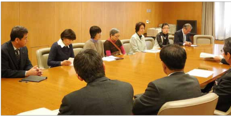
区長・副区長・担当部長等に申し入れる党区議団と区民のみなさん

2月27日、日本共産党区議団は、区が4月から実施しようとしている「区立駐輪場有料化と放置自転車撤去・保管料の徴収」の中止を求める区長への申し入れをおこない、1147筆（現在1227筆）の署名を渡しました。