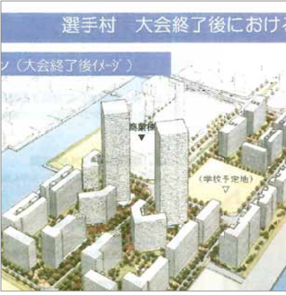
大会後の選手村タワー棟イメージ図

このプランは、民間事業者が14〜17階建ての住宅棟を22棟建設して五輪開催中の宿泊施設とし、五輪終了後にさらに50階建ての超高層住宅を2棟建て、総戸数6千戸、