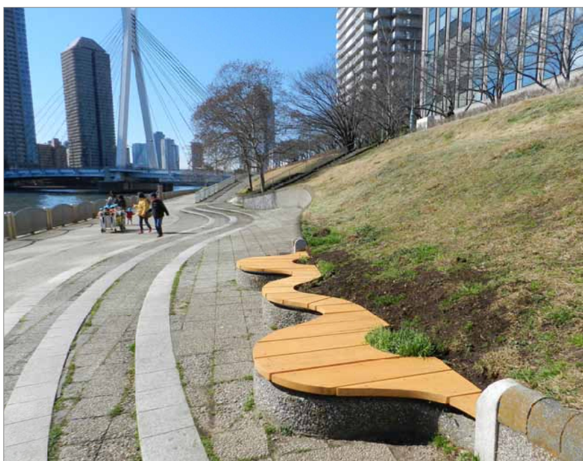
改修後のベンチ = 3 / 2 撮影

本紙729号でお知らせした「朽ちたまま放置されていた隅田川テラスのベンチ」が、1ヶ月ほどで改修されました。2月、テラスを散歩している方から報告を受け、現場に行つて写真を撮り、それを持って環境土木部長に改修を求めました。部長は、現場を管理している都に連絡し、この