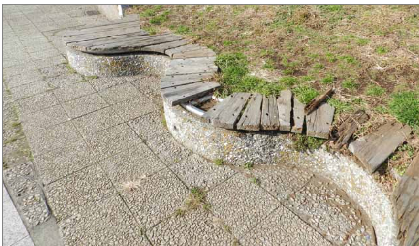
改修前のベンチ = 2 / 4 撮影