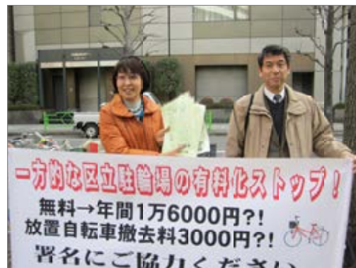
街頭で署名活動もしています=2/7

市街地再開発事業には、前年より21億円増の90億3千万円の税金を投入しようとしています。一般会計の1割を、超高層ビル中心の巨大開発に使います。