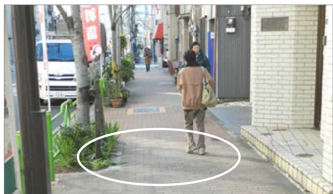
湊1丁目の歩道が街路樹の根で盛り上がり、転倒者が出たことを聞き、さっそく補修させ他の場所も点検させました。