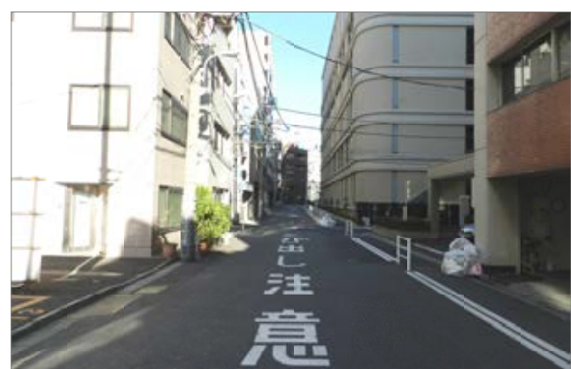
明正小近くの交差点の自転車事故をうけ安全対策を実現。