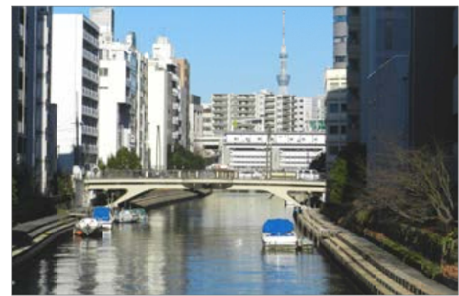
亀島川の沈みかけたいくつかの廃船を片付けさせました。