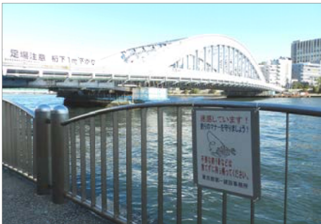
永代橋の近くに提示された看板。

また、隅田川テラスのパトロールが24時間365日行われているので、釣り人がいたときは、チラシを渡し注意の声かけをすること