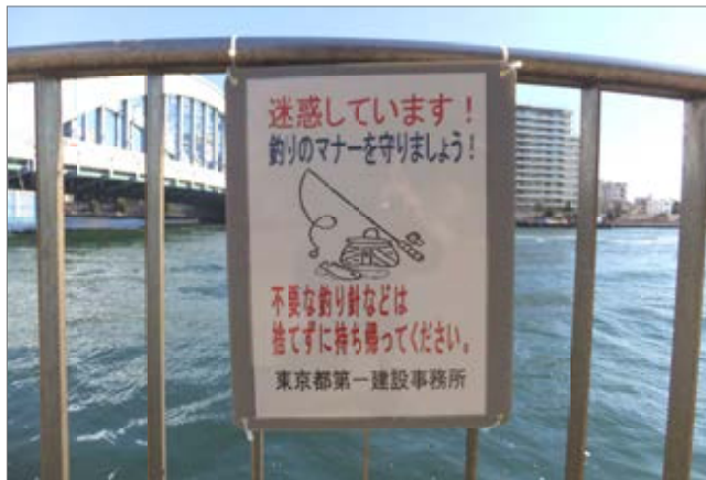
「釣りのマナーを守りましょう！」

になりました。 看板を掲示してもチラシを渡しても効果があがるかは釣り人しだいです。