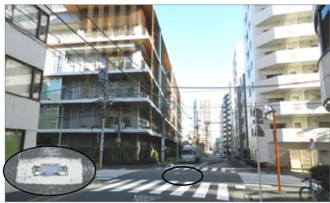
中央小近くの交通事故が多い交差点に安全対策を実現。

これまで住民のみなさんから、様々な相談やご要望が寄せられました。その一つ一つをできるだけ早く実現させることが議員の使命だと思っ て努力しています。もちろん、すべてのご要望に 応えることはできませんが、行政に 区民の声を認識してもらおうのも大 事なことだと思っています。 街のことだけでなく、生活の中 で気がついたこと、困っているこ とがありましたら、お気軽にご連 絡ください。お待ちしております。