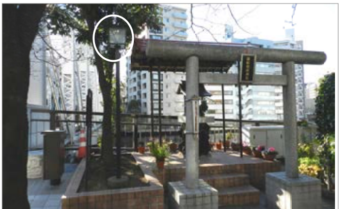
南高橋際の徳船稲荷神社に照明灯をつけさせました。