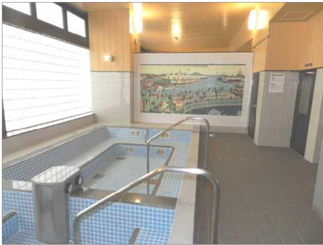
湯船につかりながら浮世絵風の絵を楽しめます。