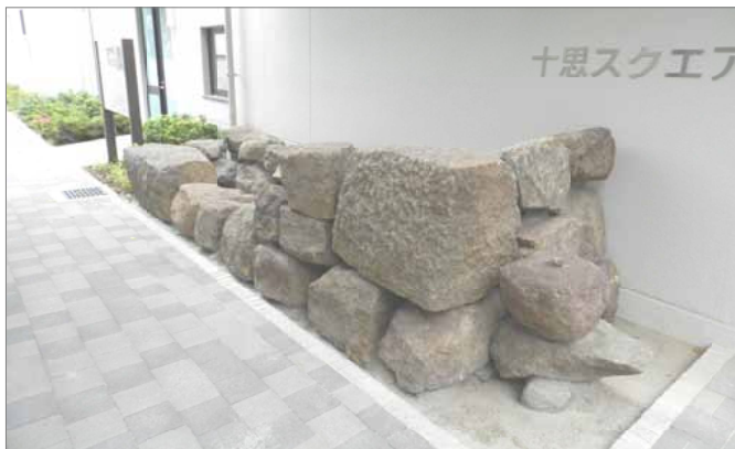
遺跡から掘り出された石垣を利用し復元。

7月3日、新しく増設された「十思スクエア別館」を視察しました。 「別館」には、地域密着型特別養護老人ホーム、温浴施設（十思湯）、地域活動の場として利用できるホールなどが整備されています。 「別館」の地下で眠っていた小伝馬町牢屋敷の遺構は、工事中に先立って12年8月に一般公開されています。そこには、井戸や上下水の木桶や枡などの水回りが集中していました。