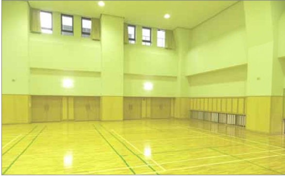
すこし小さめですがホールもあります。