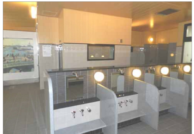
この三つの写真は女性用浴場です。