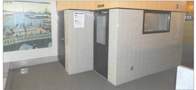
女性用浴場にはスチームサウナがあります。