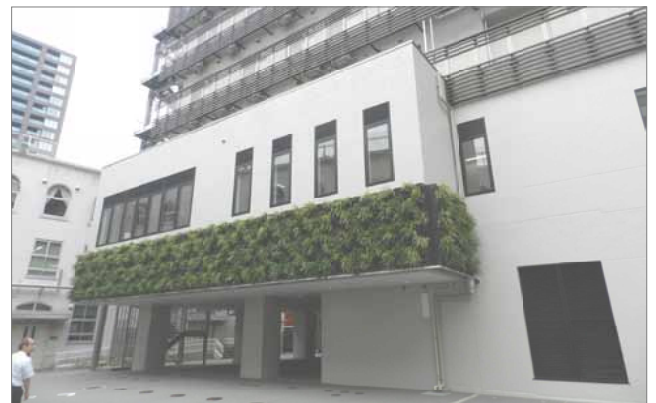
一部壁面緑化された「別館」