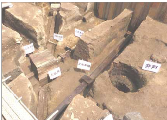
比較的保存状態が良い井戸、上水桶、枡など。