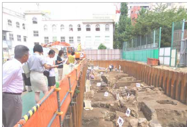
後景の建物は十思スクエア＝2012年8月10日