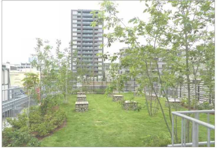
屋上はきれいに緑化されたスペースがありました。