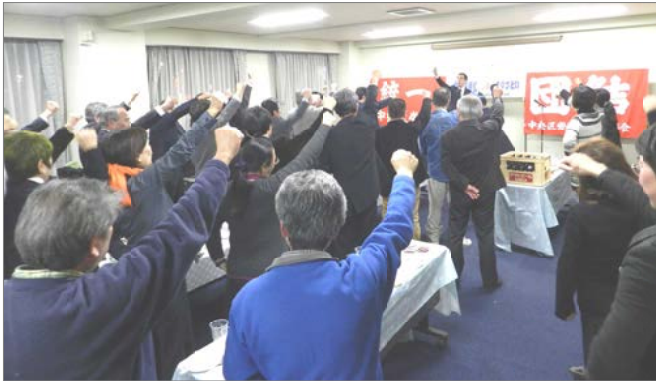
力強い団結がんばろう！でお開きに

中央区労働組合協議会（区労協）の「新春のつどい」が、1月23日、築地市場内厚生会館で盛大に開催されました。 当日は、都知事選挙の告示日と重なったこともあり、多くの方があいさつの中で選挙勝利の決意を語っていました。 区議団を代表して私は「都知事選挙が、市民団体や政党などが統一してたたかえることはたいへんうれしい」「区労協が統一と団結の力でますます発展することを願っています」と連帯のあいさつをしました。