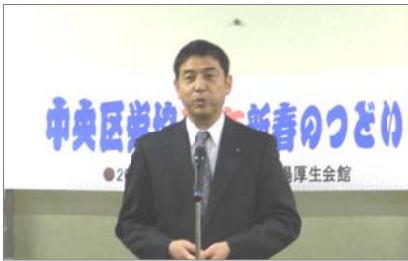
団を代表してあいさつする私