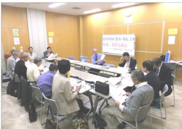
活発な意見交換がおこなわれました。

「中央区の会」は、意見交換会で交わされた内容について10月24日の世話人会で検討し、具体化することになりました。