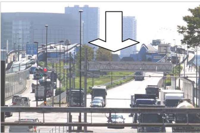
晴海大橋の間(矢印)を通り交差点(手前)に出る計画

首都高晴海線は、現在、高速湾岸線の東雲ジャンクションから豊洲出入り口まで完成しています。現在、豊洲から晴海にかけて、晴海大橋に都道が通っていますが、東京都と首都高は、豊洲から晴海わずか1・2kmに250億円もかけて高速道路を通そうとしています。ムダな公共工事の典型であるとともに、生活環境に重大な影響を及ぼす高速道路建設に反対する声が強まっています。