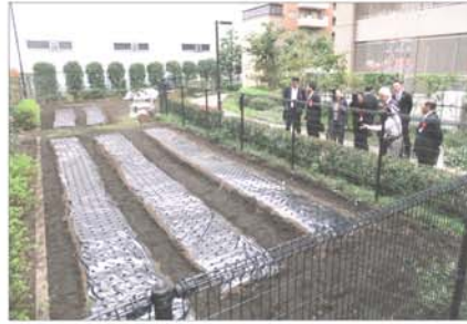
今年造成した畑を観察。小さな芽は「希望」のようです。