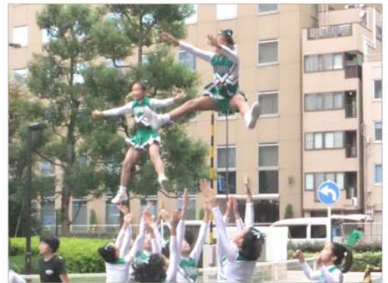
こどもチャリディング

10月14日、日本橋社会教育会館ホールで、「新日本婦人の会中央支部創立50周年祝う会」が開かれました。舞台では会員による楽しく明るい出し物が続きました。新婦人コーラス「エーデルワイス」（写真）も素敵な歌声を響かせました。