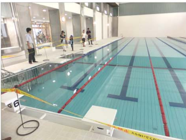
きれいなプールに見学者から歓声があがります