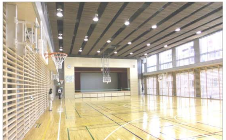
日差しが入り明るい体育館。ちょっと狭い感じも…