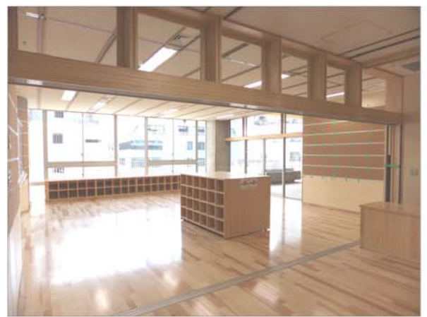
廊下の壁がない。文字通り開かれた(!?)教室