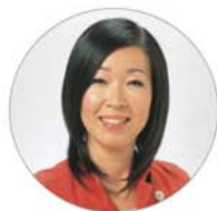
日本共産党区議会議員 奥村あきこ