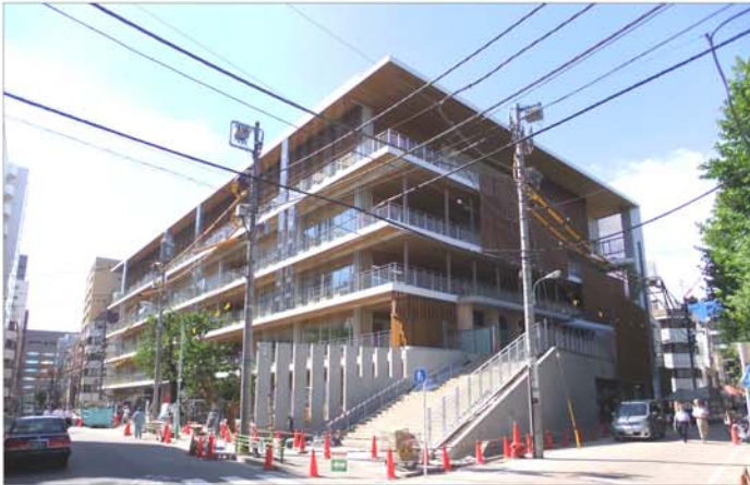
校舎の周りではまだ突貫工事中でした。

建替工事がまもなく完了しようとしている中央小学校・幼稚園の一般公開が8月3日に開かれました。 ご近所の方をはじめ明正小学校関係の方々など多くの人が完成間近の新校舎を見学しました。 幼稚園は1階で小学校は2階からとなります。明正小学校を建て替えるまで明正の児童はここに通います。屋上にある巨大な屋根付き校庭と一般開放される温水プールに見学者の関心が集まっていたようです。