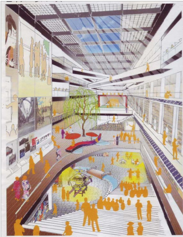
区が発表した館内のイメージ

的施設としての図書館を移転整備するとともに周辺施設を再編し、本区の文化・生涯学習・区民活動の拠点となる大規模複合施設を整備する」としています。