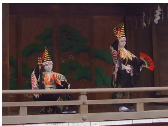
リリしい舞いは「寿式三番叟」