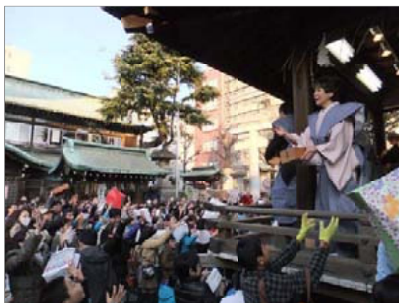
鬼は〜そと〜！ 福は〜うち〜！