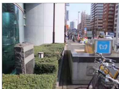
靴業創業の地記念碑(左)入船3-2-6