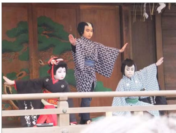
三人吉三巴白浪 大川端庚申塚の場