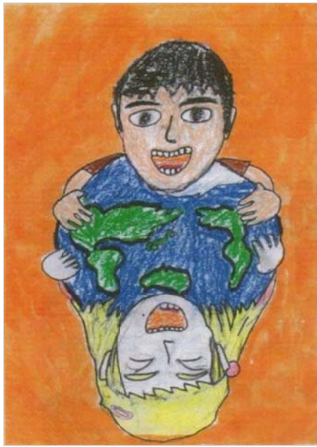
みんな なかよし 京橋築地小学校