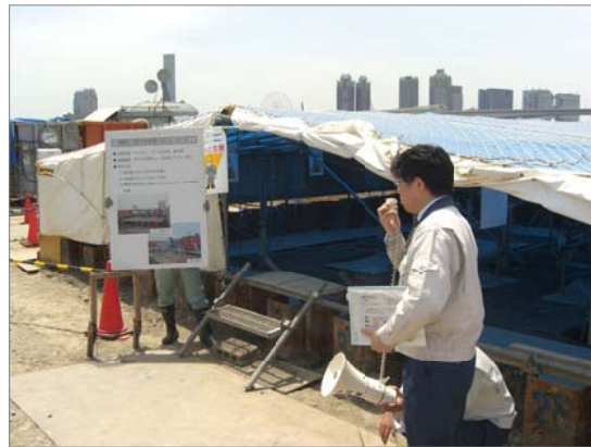
地下水処理実験現場

都の職員が説明するのですが、実 験の概要だけで、科学的な資料や詳 細な説明もありませんでした。