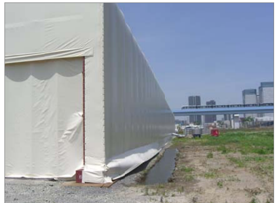
巨大テントの外見。向こうにゆりかもめが走ります