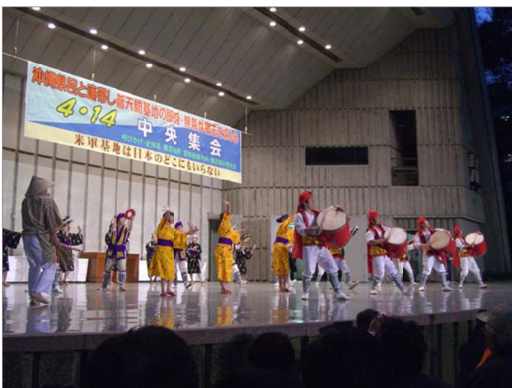
八王子民舞を学ぶ会、和光青年隊の「エイサー」の熱演

また、4月25日に開かれた沖縄県民集会は、9万人をこす参加者で歴史的な成功をおさめました。