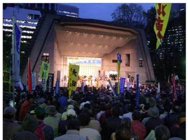
参加者であふれかえる日比谷野音