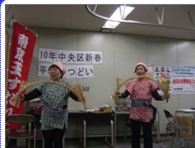
南京玉すだれも登場！

核兵器廃絶、NPT再検討会議の成功めざして「中央区 新春平和のつどい」が1月20日に開催されました。