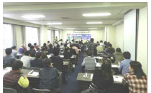
パレードに先立つ集会の様子