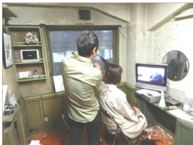
銀座奥野ビルにあるスダ美容室。希望者にはカットサービスも。