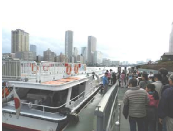
今年も人気なのは船。無料です。

イベント会場では参加者がそれぞれ楽しんでいました。ただ、知らない区民の方もいらっしやるので、取り組みの改善が求められると思います。