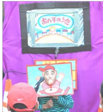
楽しい顔面紙芝居