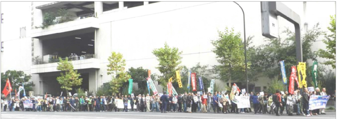
築地市場に接する新大橋通り（市場通り）をパレードする参加者のみなさん＝築地市場青果付近