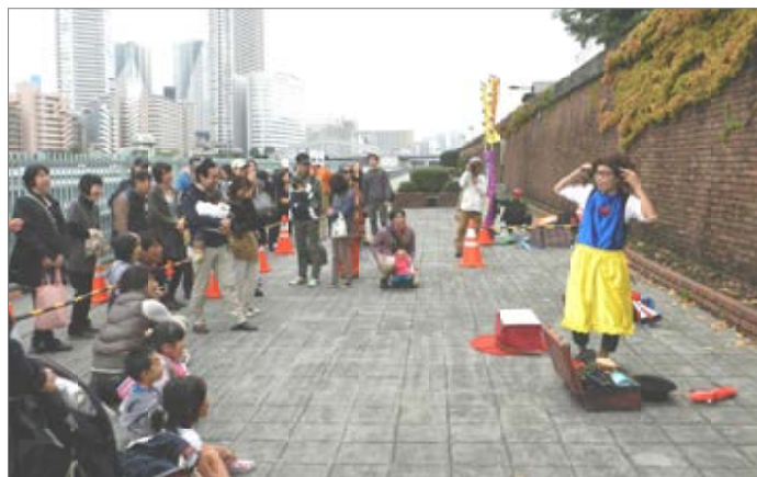
船を待つ人も大道芸に大笑い＝明石町防災船着場