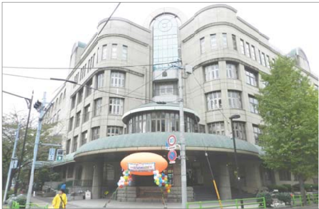
今年の会場となった月島第3小学校

11月2日、第10回をむかえた「子どもとためす環境まつり」が、今年も、月島第3小学校で開催されました。 ちなみに、第1回は、月島第1小学校で行われました。 主催は、中央区環境保全ネットワーク。共催は中央区です。 後援は、環境省関東地方環境事務所、東京環境局、東京商工会議所中央支部、中央区社会福祉協議会となっています。 会場の玄関には、いつものよう