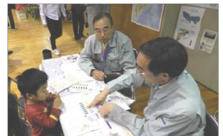
二酸化窒素の測定・分析を体験。