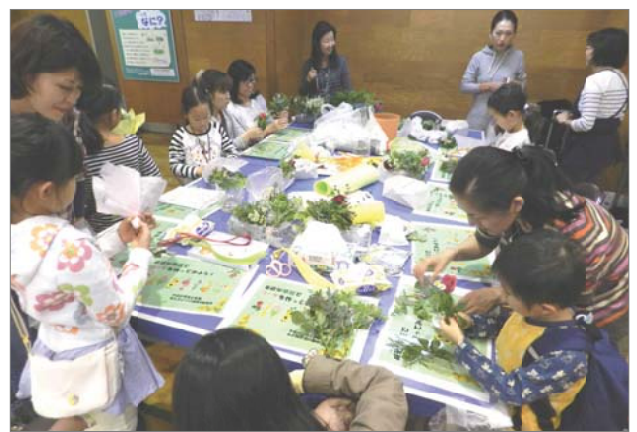
親子で楽しく草花のミニブーケづくり。