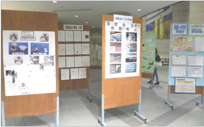
区立小学校生徒たちのパネル展示コーナー。