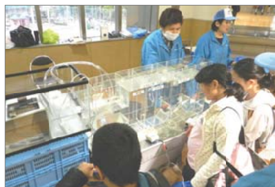
下水道の仕組み、すごい！