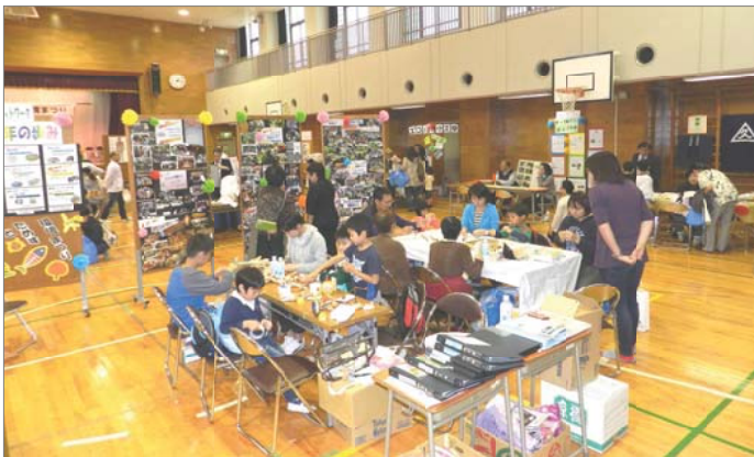
3階の体育館には様々な体験ができるコーナーが。

11月2日、第10回をむかえた「子どもとためす環境まつり」が、今年も、月島第3小学校で開催されました。 ちなみに、第1回は、月島第1小学校で行われました。 主催は、中央区環境保全ネットワーク。共催は中央区です。 後援は、環境省関東地方環境事務所、東京環境局、東京商工会議所中央支部、中央区社会福祉協議会となっています。 会場の玄関には、いつものよう