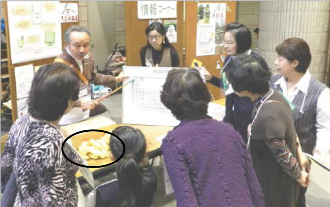
バナナ（○内）のたたき売り？いえ科学の勉強です。