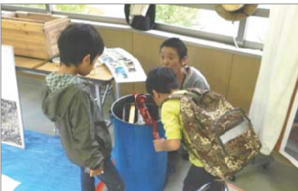
ハチミツ作りに興味津々。