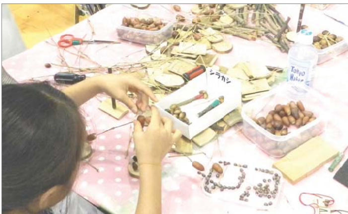
どんぐりのヤジロベ作り。バランスもバッチリ。

にオレンジ色のバルーンが掲げてありました。 「環境まつり」は、子どもたちと一緒に楽しい実験や思わぬ体験をとおして環境についての認識や発見を持ってもらおうというものです。 子どもたちがいきいきとチャレンジしている姿を見て、ほほえましいと同時に、環境問題のツケを子どもたちにまわしてはいけなないと強く思いました。