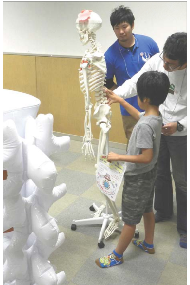
がい骨模型を触って仕組みや柔軟性を体験。