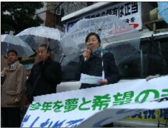
会場前で新成人にお祝いの言葉を贈る党区議団

「就職できるか不安」「原発再稼働は許せない」「戦争がない世の中になりたい」。成人を迎えたみなさんは、自分の将来や