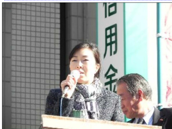
1月19日、築地4丁目交差点にて、現在地再整備を求める訴えと署名行動に参加しました。