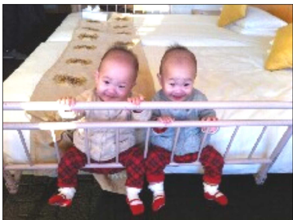
双子の娘たち。こんなに大きくなりました

今年には都議会議員選挙、参議院選挙が行われます。「国民が主人公」の政治実現のため全力でがんばる決意です。