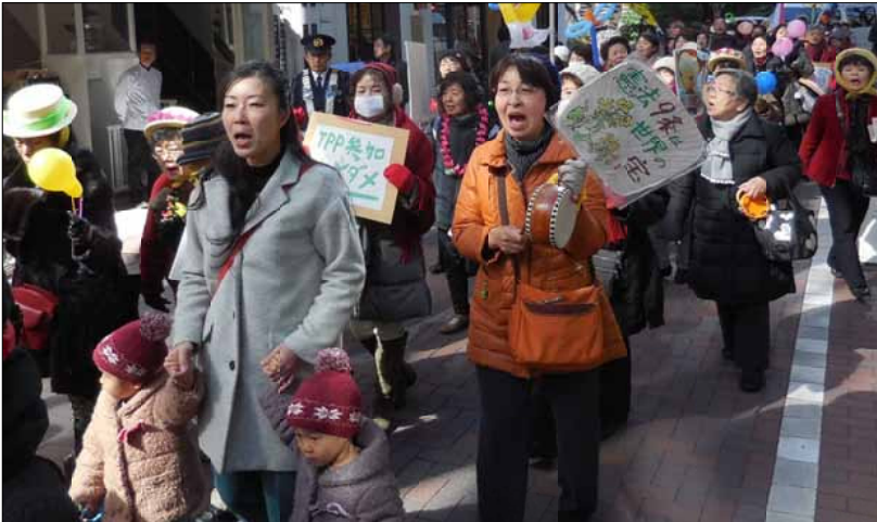
娘たちの手を引き、クールしながら歩く私（銀座1丁目にて）。

今年で30回目となる「愛と平和のバレンタインパレード」に、双子の娘を連れて参加しました。中央区内で活動する女性NG