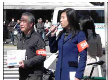
2011年3月、募金を訴える私