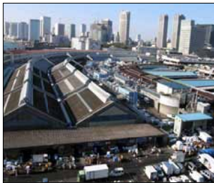
活気あられる築地市場