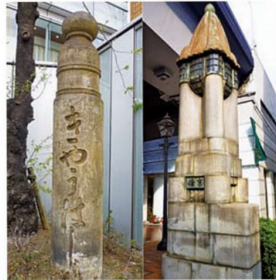
明治（左）・大正（右）の親柱