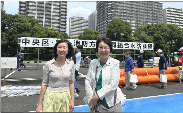
中央区・第一消防方面合同総合水防訓練に参加 左から奥村・おぐり（6/13晴海2丁目都有地）

目的に、移設に必要な経費などを区制施行80周年記念事業として支援します。 （予算額4千5百万円・移設時期は27年3月予定）