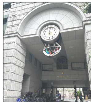
特別支援学級が設置される予定の日本橋小学校のからくり時計