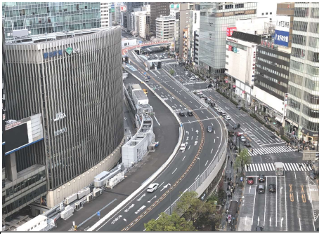
①写真：東京高速道路KK線（数寄屋橋 東急プラザ銀座より おぐり撮影） ②図：KK線区域図（太線部） （区環境建設委員会資料より抜粋）

新橋～西銀座～京橋をつなぐ東京高速道路KK線は、東京都が「再生方針」を発表し、高速道路を廃止して、上部空間を歩行者中心の公共的空間（東京スカイコリドー：全区間整備は2030年代～40年代を目標）として再生・活用する計画を進めています。