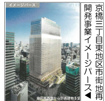
京橋三丁目東地区市街地再開発事業イメージパース