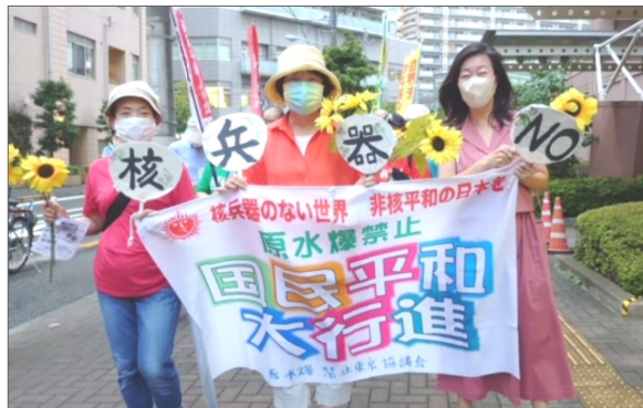
今年も7月23日、原水爆禁止をねがう平和大行進・中央区網の目行進が行なわれます。勝どき区民館前16時半出発予定です。(写真は22年7月の行進)

マイナ保険証で他人の医療情報に基づいて誤った診断や薬の処方が行われれば、命を危うくする危険