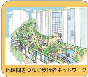
地区間をつなぐ歩行者ネットワーク

新橋～西銀座～京橋をつなぐ東京高速道路KK線は、東京都が「再生方針」を発表し、高速道路を廃止して、上部空間を歩行者中心の公共的空間（東京スカイコリドー：全区間整備は2030年代～40年代を目標）として再生・活用する計画を進めています。