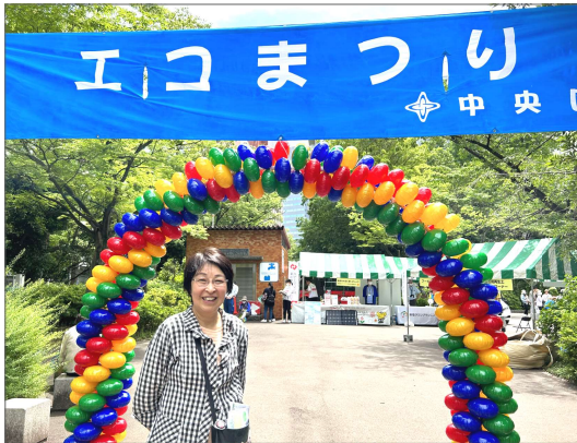
6月4日、あかつき公園で「中央区エコまつり」が行なわれました

6月7日、改選後初の区議会福祉保健委員会で、区から学童クラブの待機児童の解消を図るための方向性が示されました。 現在児童館で実施されている学童クラブと同様の内容で、学校内に学童クラブを設置し、一般登録