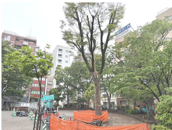
⑤写真：根回し工事中の樹木（6月13日撮影） ⑥⑦図：「準備工事のお知らせ」より抜粋

浜町公園内に、日本橋中学校の仮校舎を建設する予定地（清正公寺周辺）の「樹木保存のための準備工事」が始まっています。樹木は「伐採」せず、根回し工事（図参照）を行ない、11月頃から移植↓24年から仮校舎を設置し28年まで利用↓中学校建設工事・