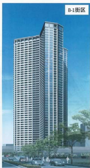
サービス付住宅などが整備される勝どき5丁目再開発の超高層マンション KACHIDOKI THE TOWER