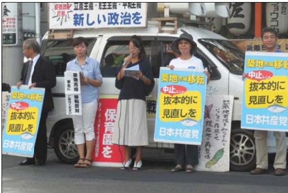
築地市場の移転は中止し、計画の抜本的見直し、築地で再整備を実現させようと宣伝する日本共産党区議団=9月9日、築地波除神社前

提言は「土壌汚染調査も汚染対策もきわめてずさんだった。全ての建物の下の盛り土を行っていないのに、やっているとの虚偽の報告で都民をあざむいて