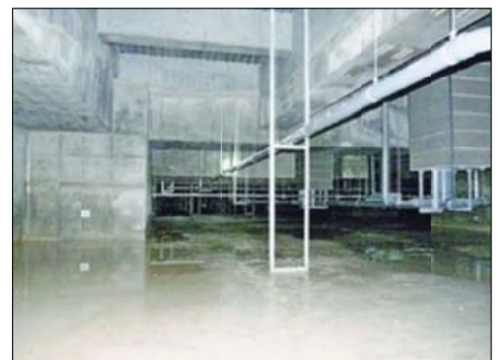
盛り土がなく地下水がたまっていた豊洲新市場の建物地下=7日、日本共産党都議団撮影

きた」と厳しく批判。「食の安全・安心に関わる重大問題」だとして、徹底究明を求めるとともに、新市場施設の建物内の大気中でベンゼン汚染が確認された問題とあわせて、第三者の専門家を交えて検証するよう提起しました。