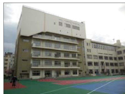
児童数の増加により校舎を増築した久松小学校