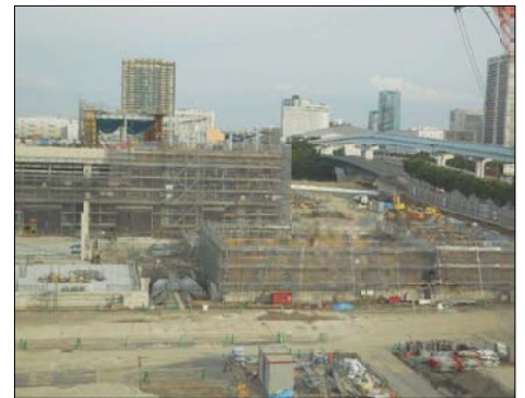
建物工事は進んでいますが問題山積の豊洲新市場＝6/7おぐり撮影

憲法9条を守り、「戦争法案」を廃案にさせるため、日本共産党区議団は、「今国会での成立に反対」という一致点を大切に、区議会として国に対する