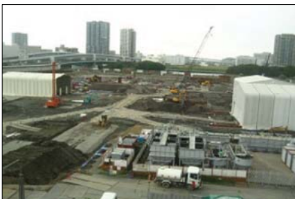
土壌汚染対策工事が続く豊洲市場予定地。処理が必要な土の量が増え、さらに1年以上かかる予定です（ゆりかもめ「市場前」駅より5/1）

豊洲新市場計画を中止することは、今なら可能です。予定地は土壌汚染対策工事中で、新市場建設は全く行われていません。農水省は土壌の安全性の確保と関係者の合意がなければ新市場の認可はしないとしています。「移転反対、現在地で再整備」の声をさらに広げることが大きな力になると確信しています。