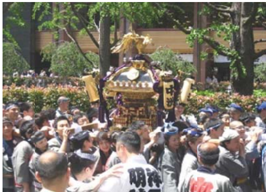
4年ぶりの神田祭本大祭。5/12撮影

名橋・日本橋の上空にかかる高速道路。1960年当時、中央区あげての建設反対の声を踏みにじて造られた「負の遺産」