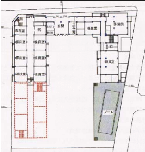
図面の点線部分が増築部分