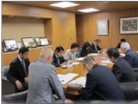
2012年度予算要望書を区長に提出した日本共産党中央区議団 (11/9/26)