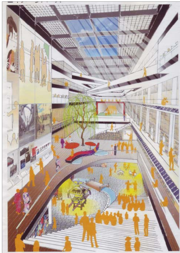
上図は2階あたりから俯瞰したイメージ図。「アナトリウム」から神輿や日本橋をイメージした橋が見えます。下図は図書館(築地)、郷土天文館(明石町)、敬老館(いきいき桜川)を移転し複合的に配置するとした断面図。(委員会資料より抜粋)

9月1日の企画総務委員会に、労働スクエア東京跡地に予定している「複合施設整備の基本コンセプト」が報告されました。 生涯学習の拠点施設 区の説明では「生涯学習の中心的施設としての図書館を移転整備するとともに周辺施設を再編し、文化・生涯学習・区民活動の拠点となる大規模複合施設を整備する」としています。