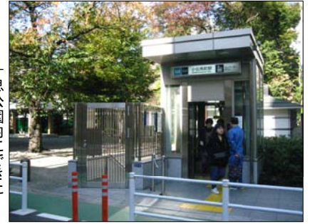
十思公園内にできた 小伝馬町駅エレベータ