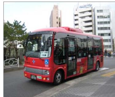
赤い車体の江戸バス

土・日・祝日のみ、水天宮手前の信号を右折し次の角をすぐ右折して、ロイヤルパークホテルの玄関にバス停を設ける。水天宮や地下鉄エレベータへのアクセスを良くする。