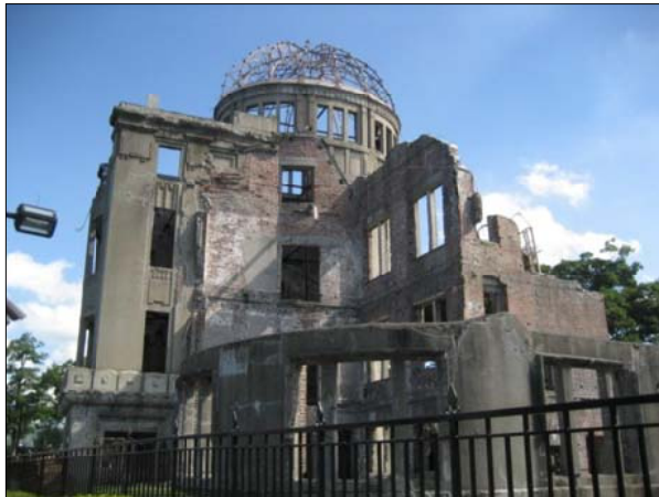
核廃絶の誓いのシンボル「原爆ドーム」(8/6 おぐり撮影)