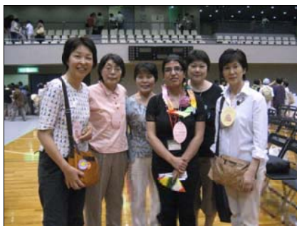
8/5の「核兵器なくそう女性のつどい2010」に参加された海外代表(右から3人目)と記念撮影。左端が私。