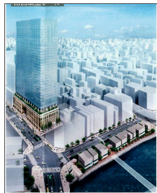
▲室町1丁目地区（山本海苔ビル周辺）イメージ図。低層建物にする川沿いの地区と区道でつなぎ、地上36階高さ180mの超高層ビルを建築。

中央区は、首都高日本橋区間の地下化とその周辺の5地区の再開発を進めていますが、6月の環境建設委員会ですでに都市計画決定されている3地区以外の2地区について、計画概要が決まり、都市計画手続きに入ると報告がありました。 新たに都市計画手続きに入るのは日本橋1丁目1・2番地区（榮太樓ビルビル周辺）と日本橋1丁目東地区（日本橋郵便局周辺）（地図の濃いグレーの地区）。 首都高地下化工事で川の上空に空を取り戻すとしていますが、日本橋川の周辺は高さ140mから290mの超高層ビルに囲まれてしまいます。 コロナ後の社会を考えたとき、こんな超高層ビル林立のまちが必要なのか、おおいに疑問です。