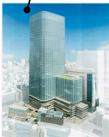
日本橋1丁目中地区▶ （日本橋コレドの川側）。C街区には5地区中で一番の高さとなる287mの事務所・ホテルのビル