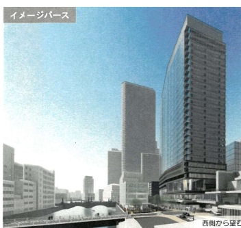
▲新たに都市計画手続きに入る日本橋1丁目1・2番地区（榮太樓ビルビル周辺）。A街区は地上27階高さ140m、川沿いC街区は地上7階高さ31mなど、4棟建設。