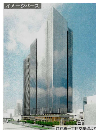
A街区は地上40階高さ240mの事務所、現日本橋郵便局のB街区は地上52階高さ225mの住宅棟、江戸橋でつなぐ川沿いCD街区は緑地広場。