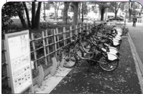
「黎明橋公園」前のポート