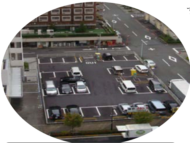
現在は駐車場として利用されている C2棟予定地（晴海三丁目7番）

11月2日に開催された「中央区都市計画審議会」において「晴海三丁目西地区第一種市街地再開発事業」で唯一残っていた「C2棟（晴海三丁目7番）」の計画概要についての説明がありました。 C1棟（東京海員会館）横、現在駐車場として利用されている「C2棟予定地」に、特定事業者「住友不動産（株）」が、地上6階地下2階の医療施設をつくりまします。 医療事業者には、以前月島一丁目で開業していた「中央サマリア病院」を予定し、施設計画は2階〜3階が診療施設、4階〜6階が入院施設になり41床のベッド数が計画されています。工事着工は2016年夏頃を予定しています。現在、施設計画の詳細は、特定事業者と協議が行われていま