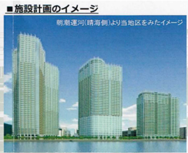
■施設計画のイメージ 朝潮運河（晴海側）より当地区をみたイメージ 施設計画のイメージ 朝潮運河（晴海側）より見たマンション群 裏面もご覧ください

私は、9月10日、11月12日開催の環境建設委員会において、建物の北側のマンションや戸建て住宅には、日照が奪われ、冬場